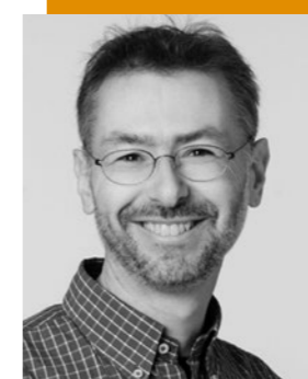
Roman Fröhlich Marketing & Kommunikation, Alternative Bank Schweiz

Die Alternative Bank Schweiz AG wird von über 6'500 Aktionärinnen und Aktionären getragen. Sie weist eine Bilanzsumme von rund 1,8 Milliarden Franken aus und betreut mehr als 35'000 Kundinnen und Kunden.